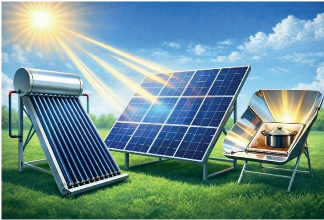
Figura 2. De izquierda a derecha se muestra de manera ilustrativa un calentador solar de agua, panel solar para la generación de energía eléctrica y una estufa solar. Imagen creada con asistencia de IA (ChatGPT)

En cuanto a la viabilidad y espacio, es más común la adaptación de paneles solares (constituidos por celdas solares) y calentadores solares en los techos de hogares de zonas urbanas, mientras que las estufas solares suelen instalarse más comúnmente en zonas rurales debido a su diseño robusto. A continuación, se explicará de manera breve en qué consiste el funcionamiento y diseño de un panel solar, un calentador solar y una estufa solar (Fig. 2).